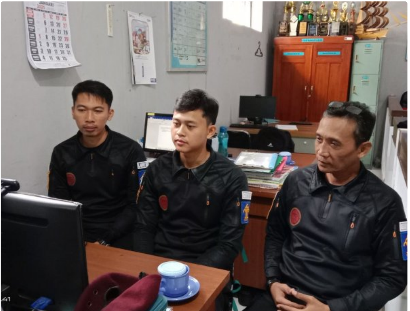
Bangun Harmoni dan Strategi, Lapas Besi Ikuti Webinar Refleksi Akhir Tahun 2024 & Resolusi 2025

CILACAP – Sebagai salah satu langkah dalam pengembangan kompetensi bagi Aparatur Sipil Negara (ASN), Petugas Lembaga Pemasyarakatan Kelas IIA Besi berpartisipasi dalam kegiatan webinar bertajuk "Refleksi Akhir Tahun 2024 dan